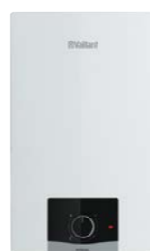
eloSTOR plus VEN/VEH