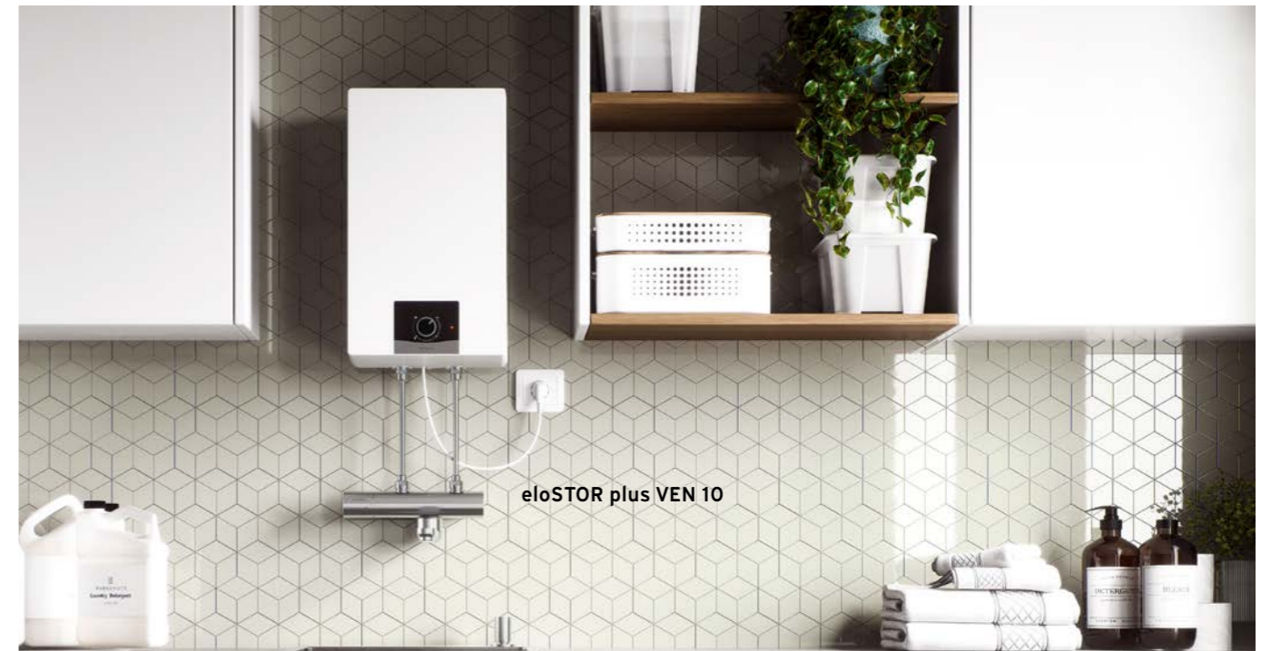
eloSTOR plus VEN 10