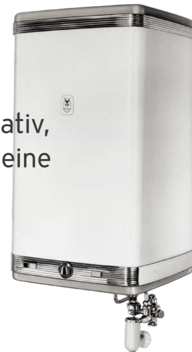
Elektro-Warmwasserspeicher von 1965

Bis heute hat das, was unser Firmengründer im Jahr 1874 gesagt hat, Gültigkeit für uns. Was in Remscheid begann, ist längst globales Teamwork geworden. Vaillant entwickelt länderübergreifend mit rund 15.000 Mitarbeitenden wirtschaftliche, energieeffiziente und umweltfreundliche Lösungen zum Heizen, Lüften und zur Warmwasserbereitung – mit dem Qualitätsversprechen einer deutschen Traditionsmarke.