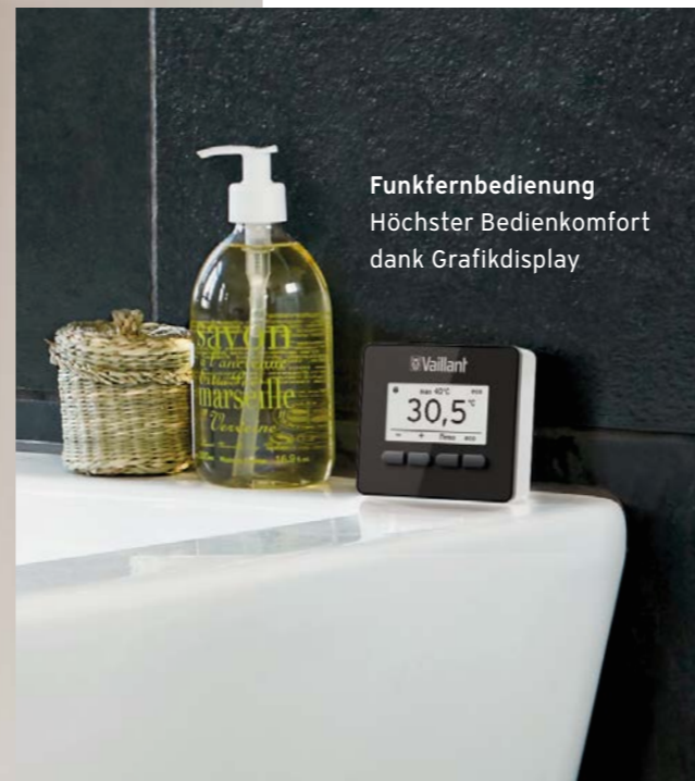
Funkfernbedienung Höchster Bedienkomfort dank Grafikdisplay

Unsere elektronischen Durchlauferhitzer erzeugen schnell und effizient warmes Wasser, wo es besonders wichtig ist: im Badezimmer .