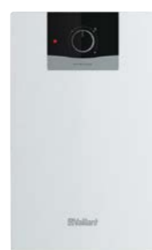
eloSTOR exclusive VEN