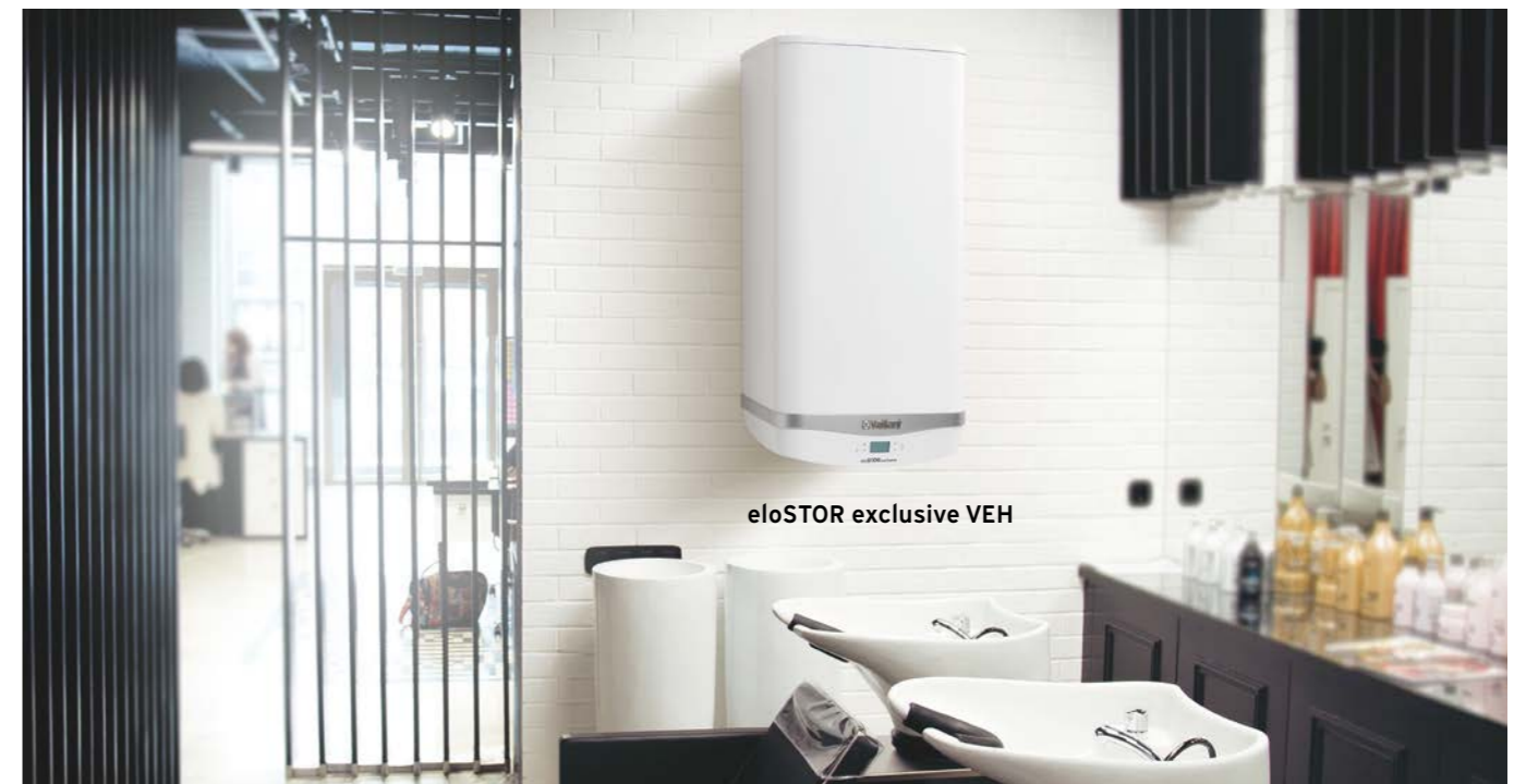
eloSTOR exclusive VEH