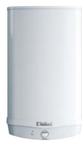
eloSTOR pro VEH