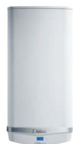
eloSTOR exclusive VEH