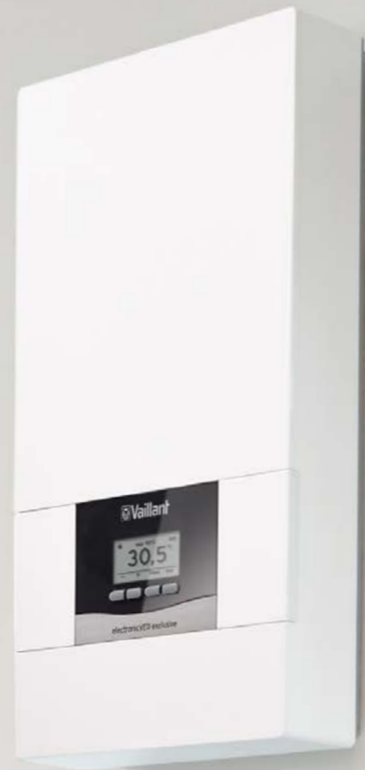
electronicVED exclusive Schlankes Design, nur 99 mm Tiefe